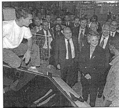
La visite de l'école de formation des Compagnons du solaire